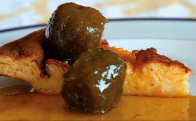
Gevulde puddingcake met pruim