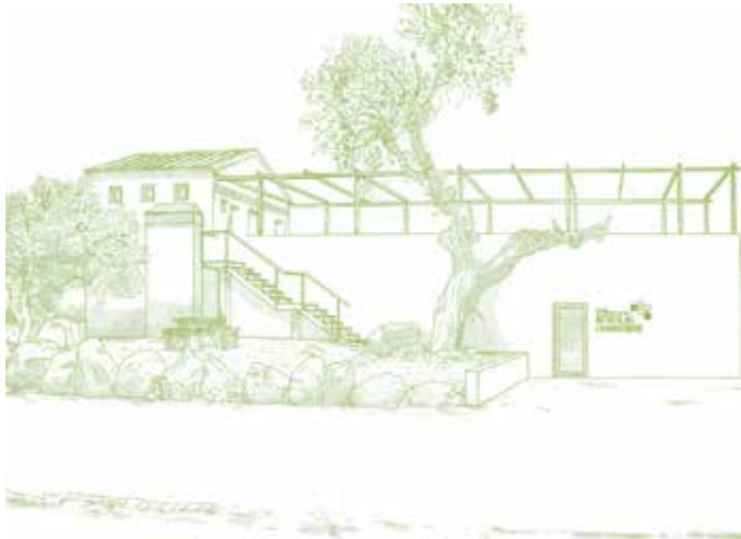
Informatiecentrum natuur, honing en biodiversiteit op het landgoed van Adães, een project gericht op een duurzame toekomst.

Vanaf het bolwerk van Oguela kunnen we in het westen de plaats zien waar we aan het einde van deze route uitkomen. We dalen af via de brede weg, die ons tussen de traditionele olijfgaarden door al snel op de oever van de rivier Abrilongo brengt, die we stappend van steen op steen oversteken. Een kilometer lang lopen we stroomopwaarts door de typische vegetatie van het rivierlandschap. Daarna verlaten we de oever en volgen we de grenslijn. De aarde kleurt hier rood, een teken dat we in een ander geologisch gebied zijn beland. Weldra komen we bij de overblijfselen van oude ovens waarin kalksteen werd getransformeerd tot kalk. Vervolgens blijven we langs de grens lopen, voortdurend vergezeld door olijfbomen aan onze kant van de grens. Weer steken we de Abrilongorivier over, en dan komen we op het landgoed van Adães. Via de prachtige open vlakke bereiken we het informatiecentrum, waar informatie te verkrijgen is over de natuur, honing en biodiversiteit. Het management van het landgoed zet zich sterk in voor het milieu: biologische landbouw, behoud van biodiversiteit en aandacht voor het milieu. We nemen afscheid van het centrum en vervolgen onze weg naar Degolados, het eindpunt van onze route, op 8km afstand van Campo Maior.